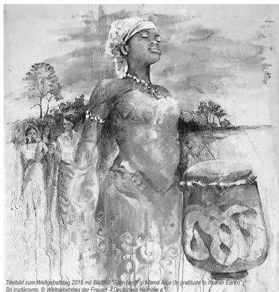
Titelbild zum Weltgebetstag 2018 mit Bildern: „Gloria Mater et Maria Alisa (in gratitude to God and Earth)“ Sn Ickekromo

Am 2. März laden die Frauen aus Surinam zum Weltgebetstag unter dem Thema „Gottes Schöpfung ist sehr gut“ ganz herzlich ein. Surinam ist das kleinste Land Südamerikas und doch eines seiner buntesten. Über 90 % des Landes sind von Regenwald aus 1000 verschiedenen Bäumen bewachsen.