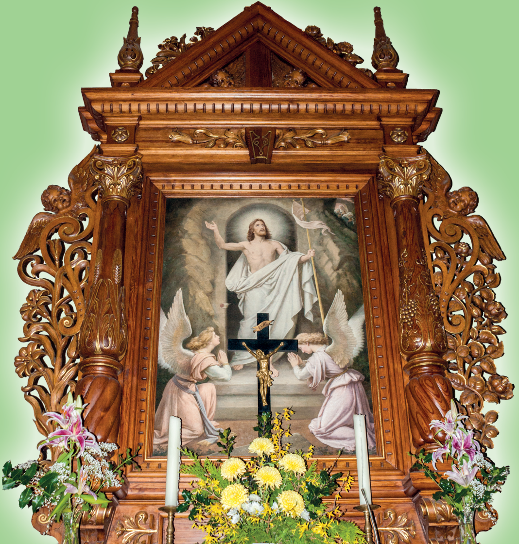
Altarbild Pauluskirche Sehma